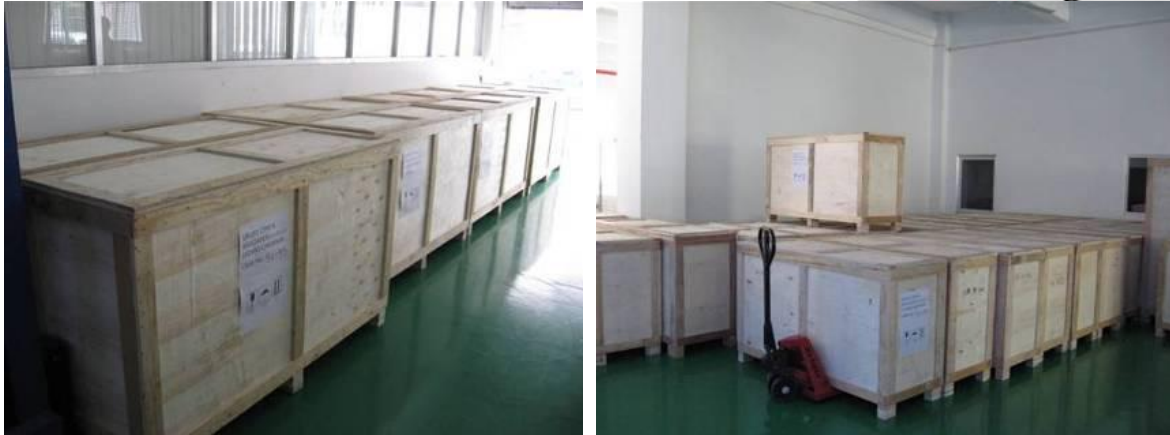
Cajas de madera para envío aéreo y mercancías en bodega, listas para la carga al contenedor.