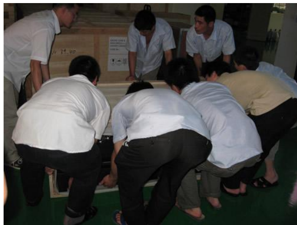
Maniobran con mucho cuidado para cargar las pantallas.