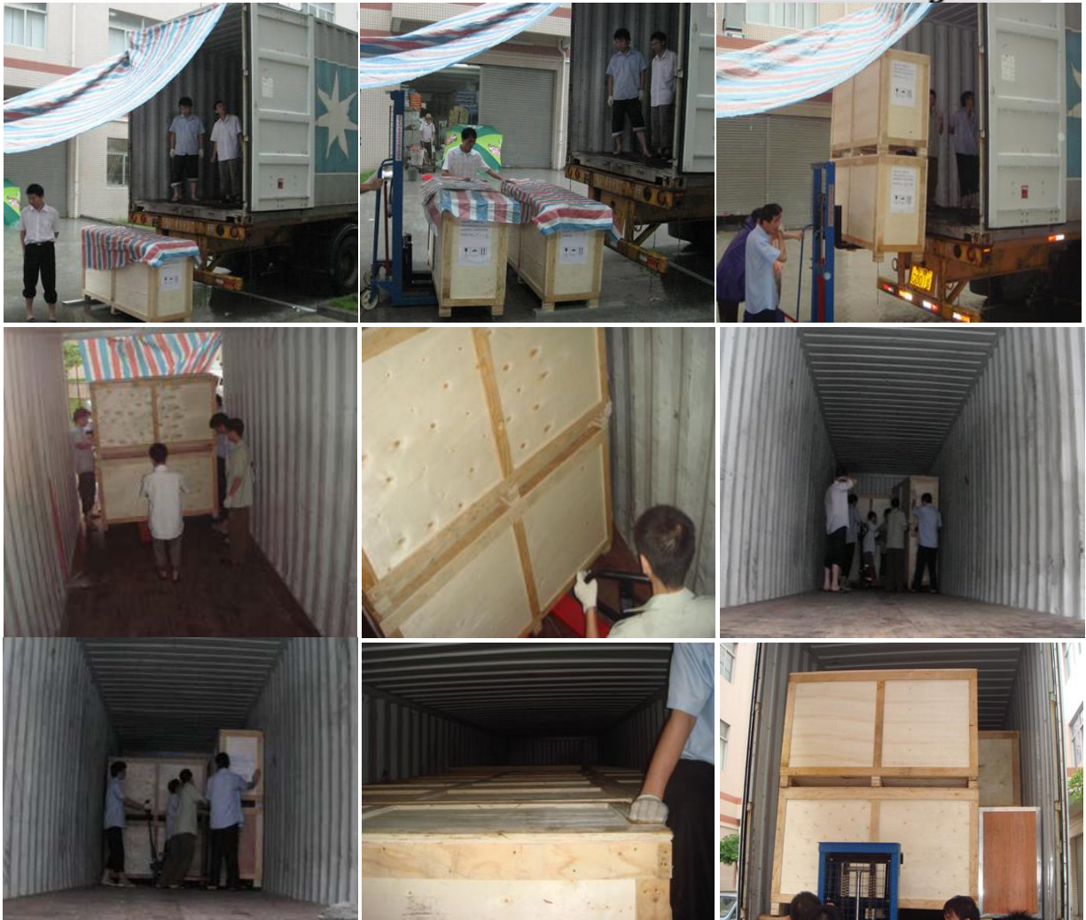
Proceso de cargar las cajas al contenedor.

Espero que esta información te sea de utilidad. Cualquier cosa estamos en contacto.