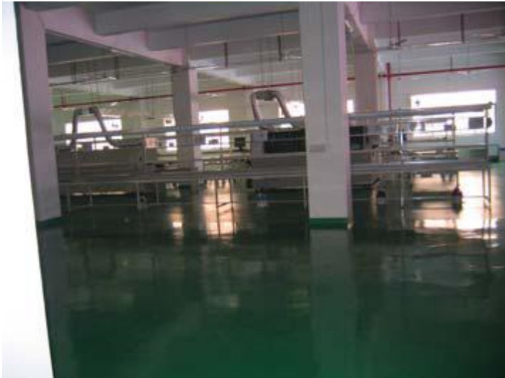
Líneas de producción.