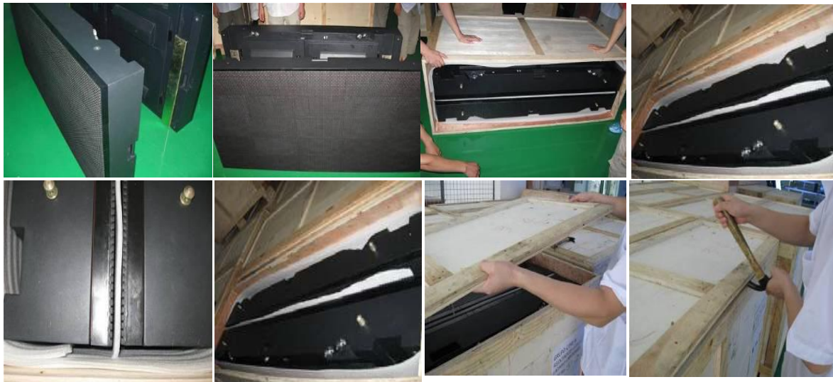
Se ponen dos pantallas en cada caja de madera para envío aéreo con material adecuado para evitar daños durante la transportación.