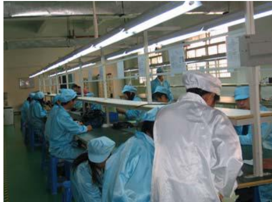
En proceso de producción.