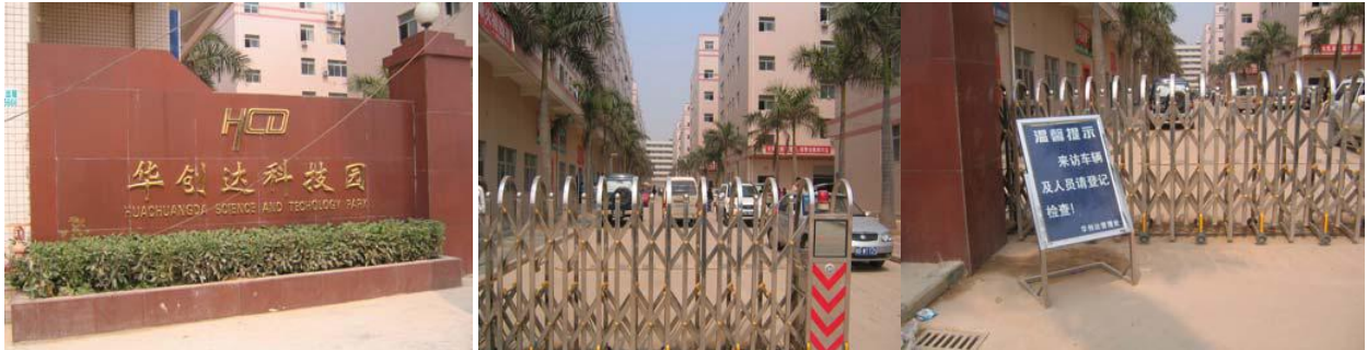
La entrada del Parque Industrial donde se encuentra la planta