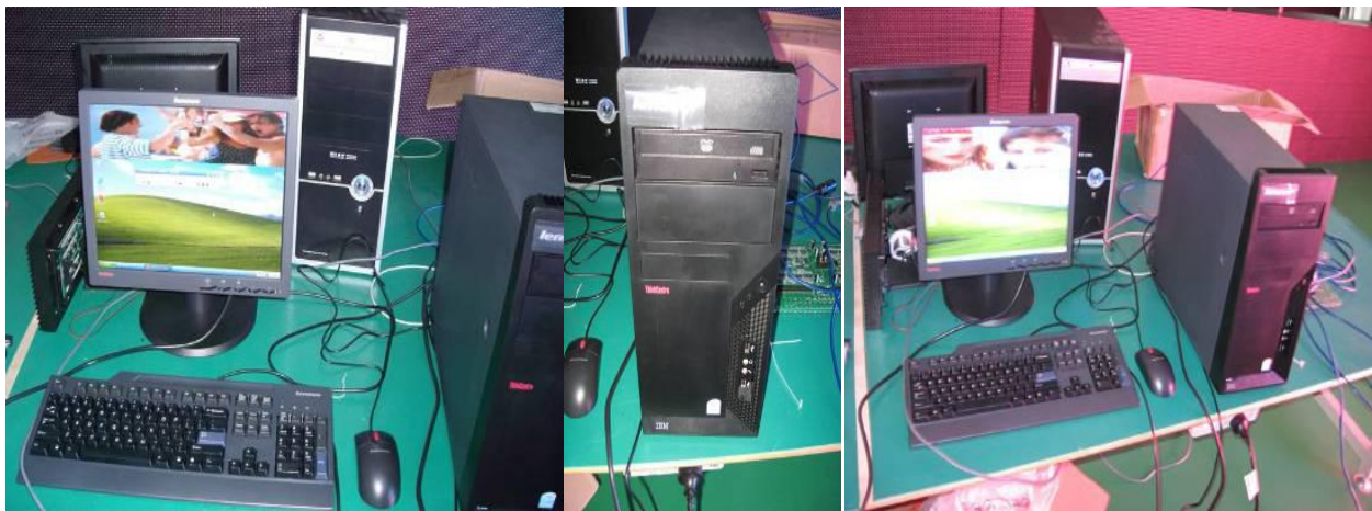
Ejemplo de sistema de control que va con las pantallas. El costo incluye el sistema de control.