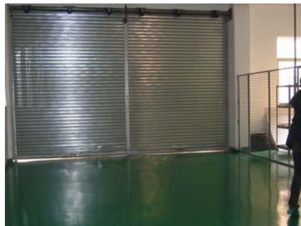
Bodega del proveedor.