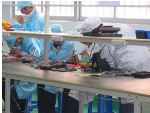
Ensamble y prueba.