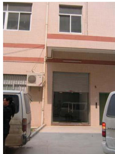
La entrada del área de producción.