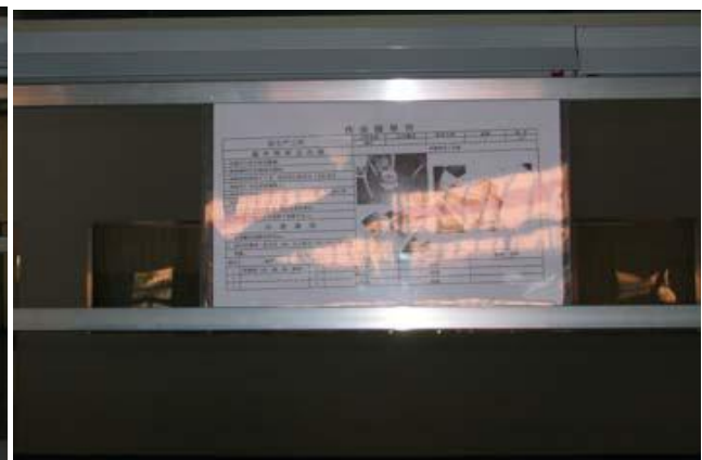
Área DIP e instrucciones de trabajo DIP.