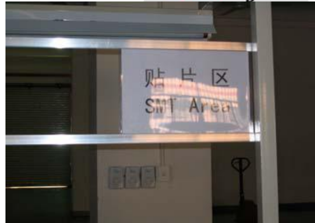
SMT área e instrucciones de trabajo.