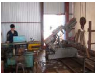
Proceso de cutting

Taller de ensamblaje Taller de parts -cutting