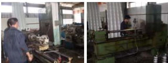
Procesamiento de las partes