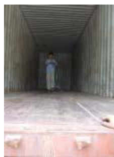
Medir el contenedor 40' HQ(también tú necesitas un 40'HQ)