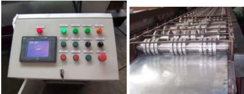
Panel de control en función Cold Rolled Plates alimentado por la parte trasera.