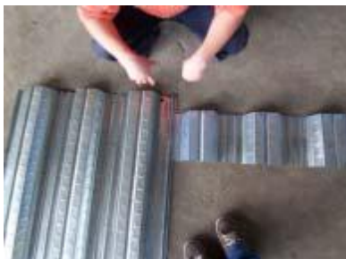
Foto de c3mo amarrar los productos.

Pero esta variaci3n en ancho no afecta el uso del producto acabado.