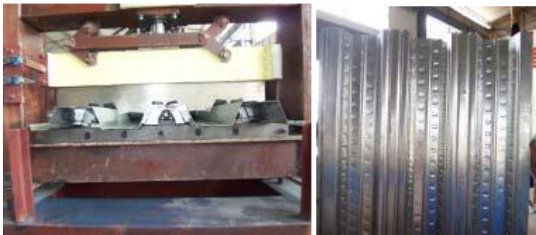
Saluda de la parte delantera, producto acabado. Medir el producto acabado.